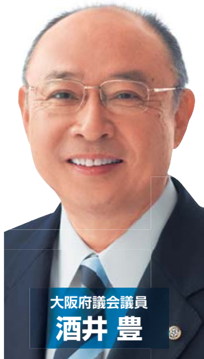
大阪府議会議員 酒井 豊